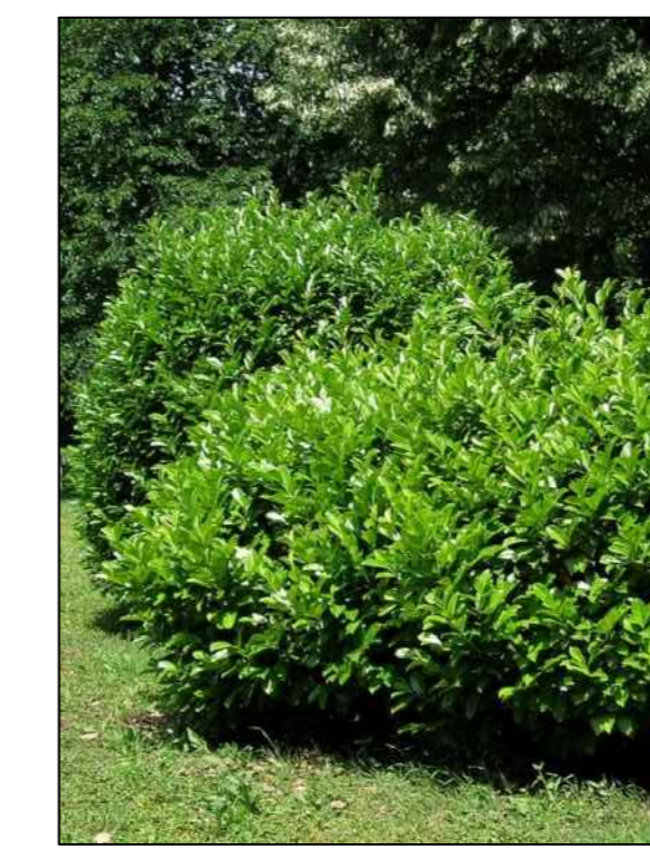
laurierhaag mano Prunus laurocerasus Mano