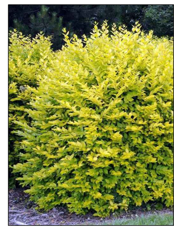
Ligusterhaag Ligustrum ovalifolium Aureum