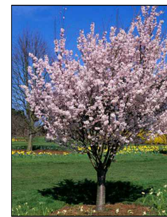
F - Sierkers Prunus Pandora