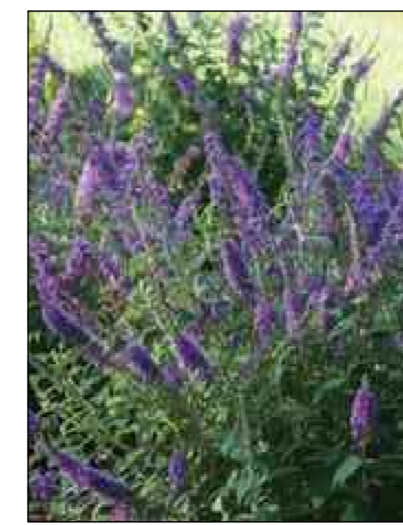
Dwerg vlinderstruik Buddleja blue chip