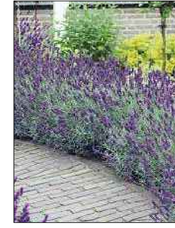
Lavendel Lavandula angustifolia Hidcote