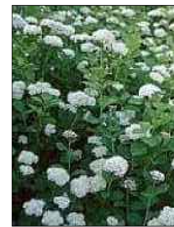
Spierstruik betulifolia Tor Spirea betulifolia Tor