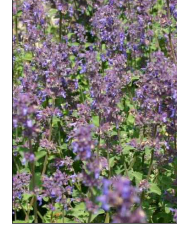
kattenkruid nepeta racemosa grog