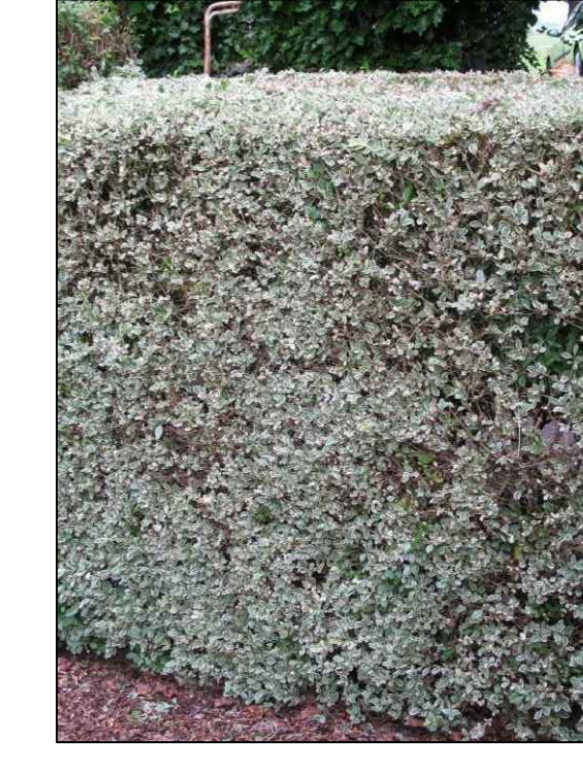
Ligusterhaag Ligustrum ovalifolium Argenteum