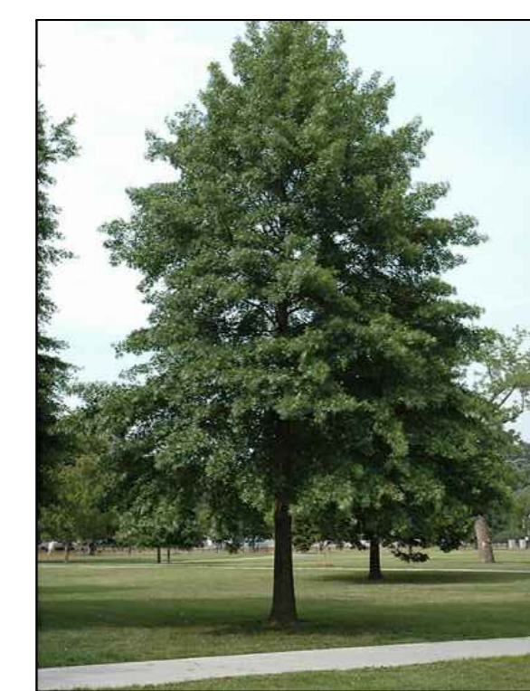
J - moeraseik Quercus palustris