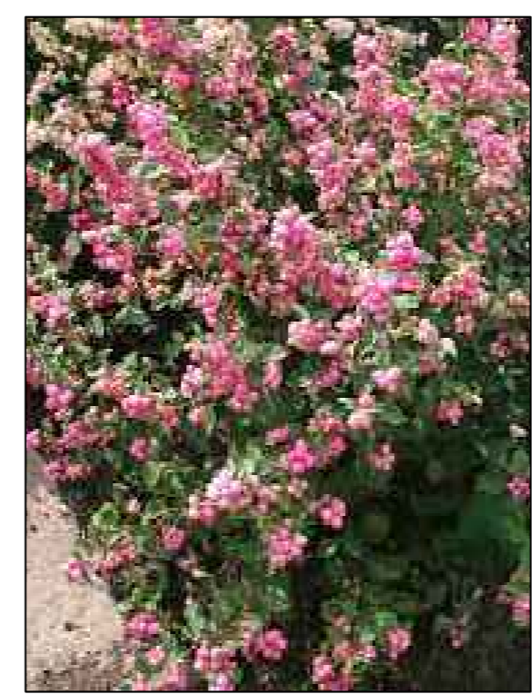
Sneeuwbes Symphoricarpos Pink Blizzard