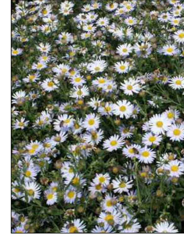
Zomeraster Madiva Kalimeris incisa 'Madiva'