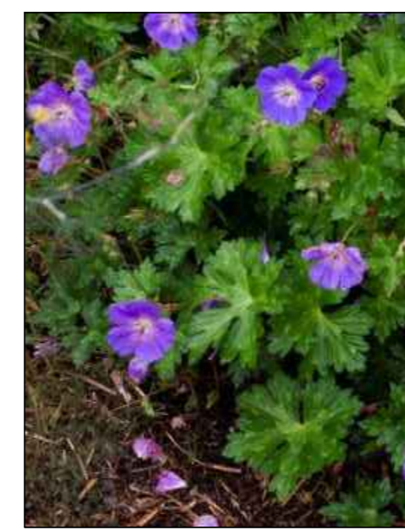
Doelvaarsbek Geranium 'Rosanne'