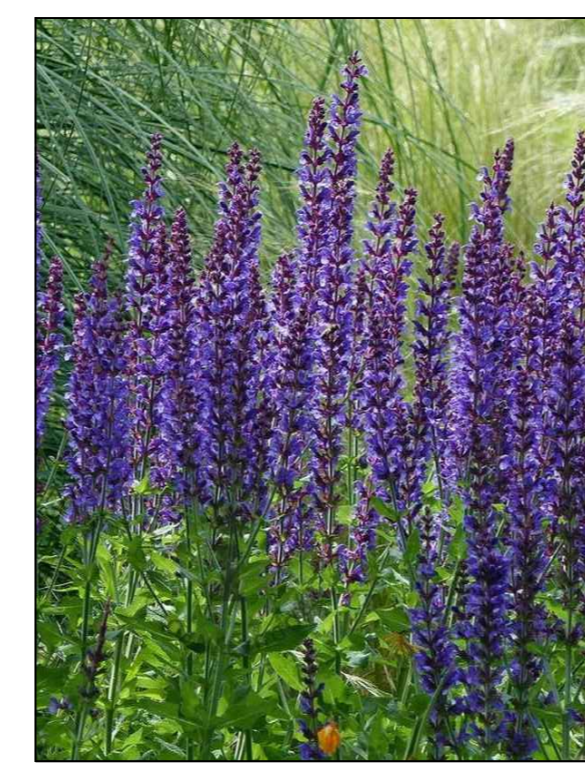
Mainacht Salvia nemorosa 'Mainacht'