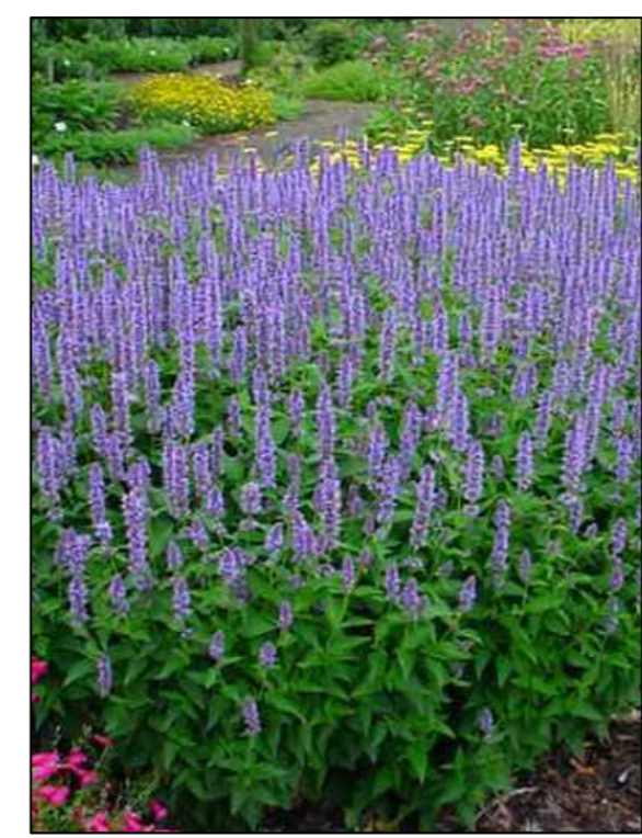
Anijsnetel Agestage blue Fortune