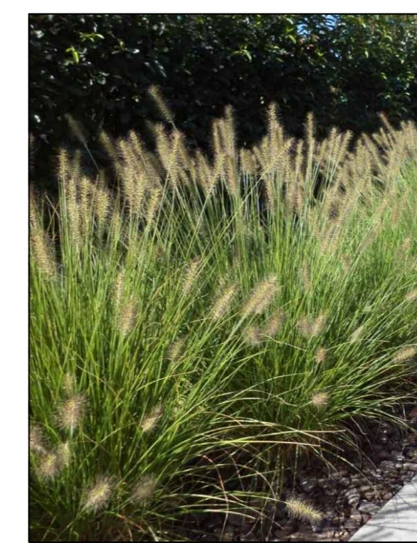
Lampenpoetsgras Pennisetum alopecuroides