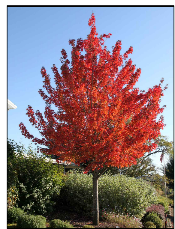
A - rode esdoorn Acer rubrum Redpointe