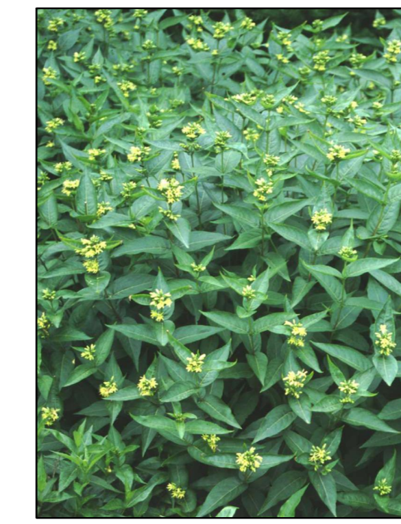
Diervilla Diervilla sessilifolia 'Butterfly'