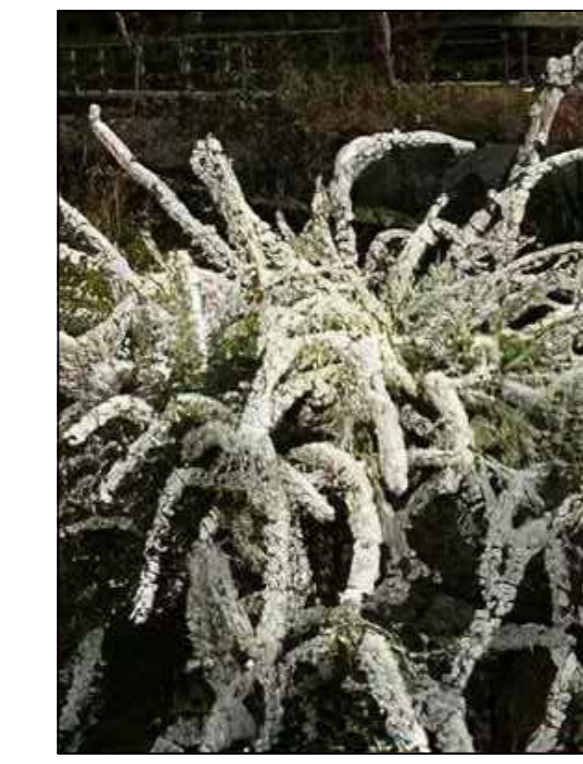
Spierstruik Thunbergii Spirea Thunbergii