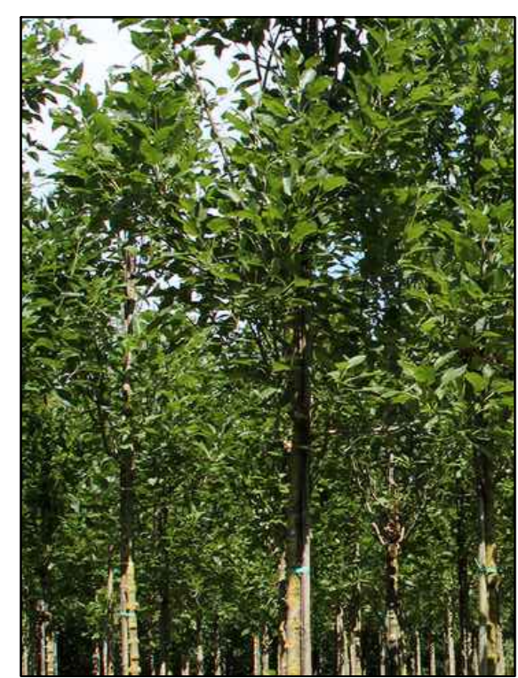
E - eenbladige es Fraxinus excelsior Diversifolia