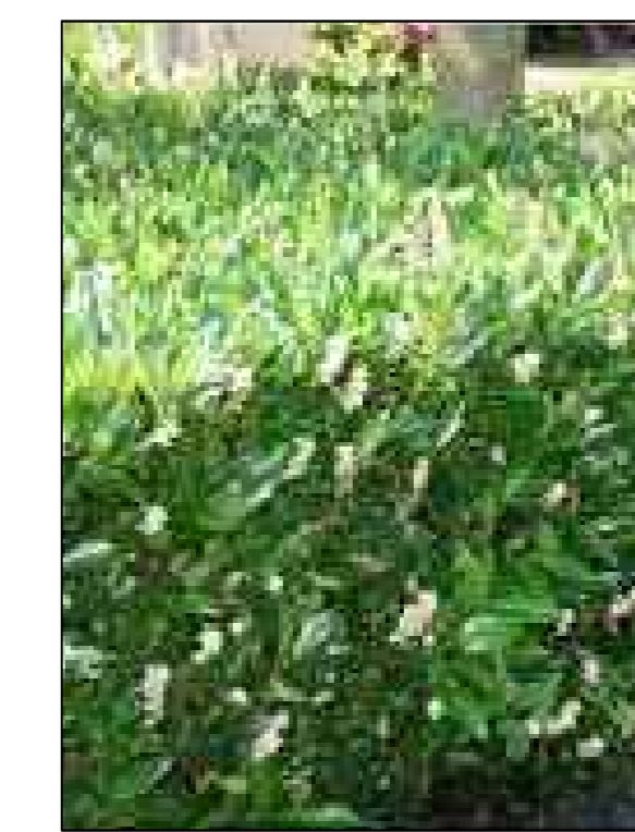
Laurierhaag Otto luyken Prunus laurocerasus Otto luyken