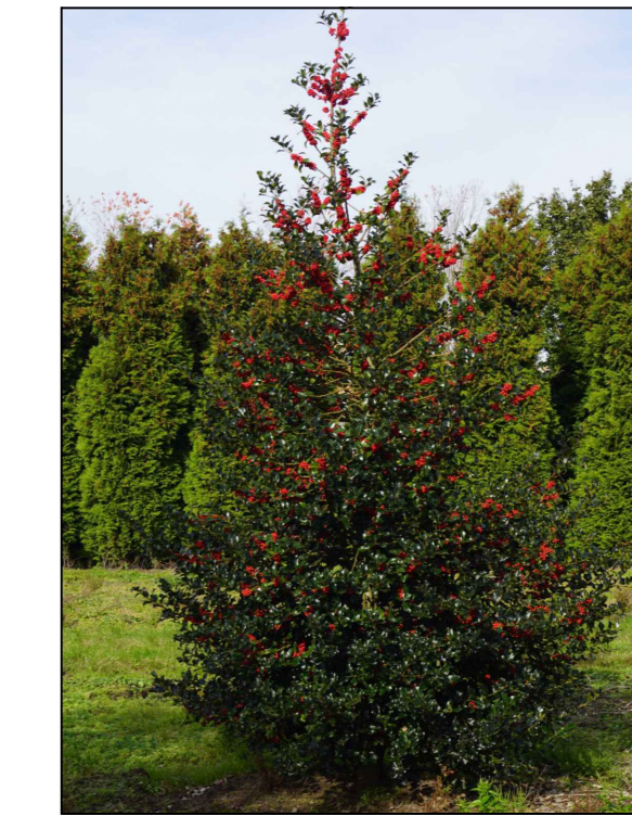
Gewone hulst Ilex aquifolium solitair