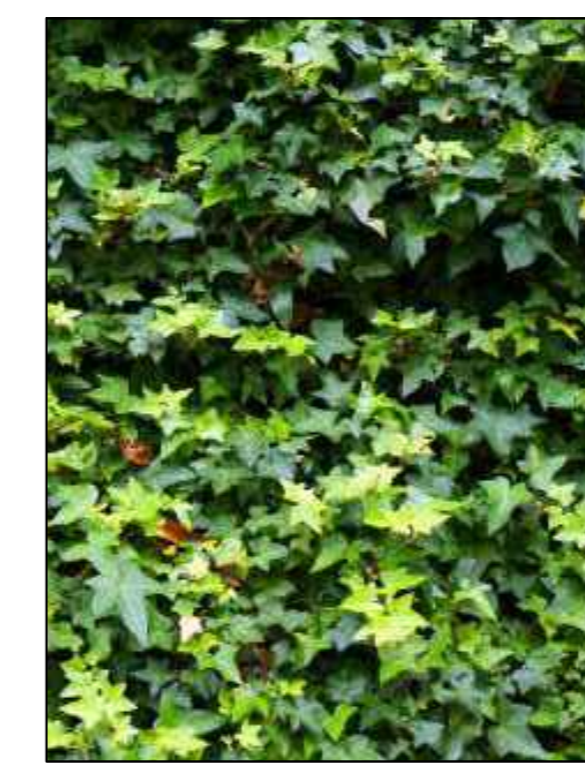
Struik klimop hedera helix