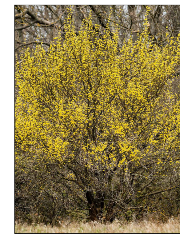
Kornoelje Cornus mas solitair