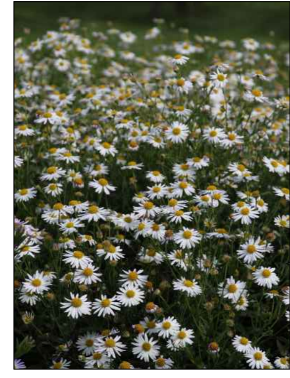
Zomeraster Alba Kalimeris incisa 'Alba'