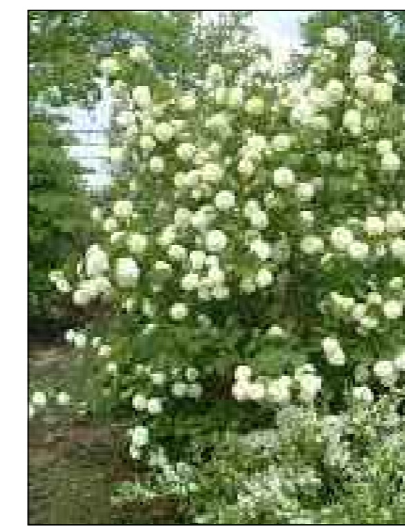
Gelderseroos Viburnum opulus Roseum