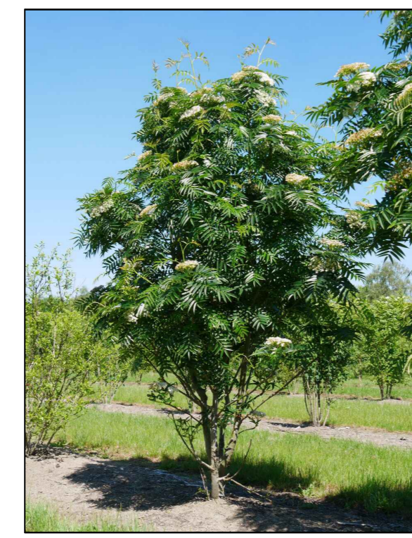
H - leisterbes Sorbus Dodong