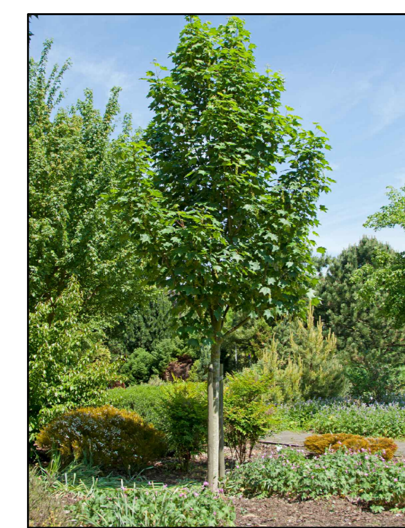
B - gewone esdoorn Acer pseudoplatanus Bruchem