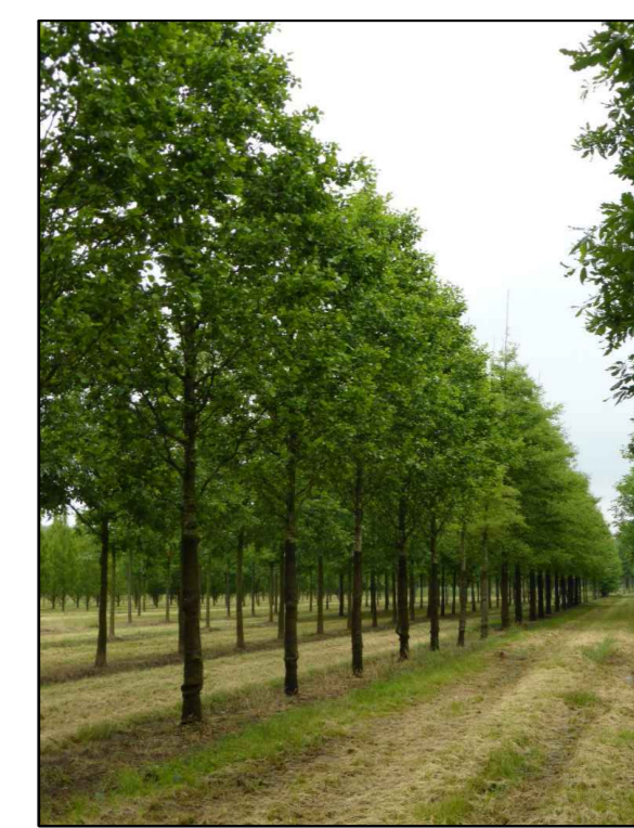
C - zwarte es Alnus glutinosa Pyramidalis