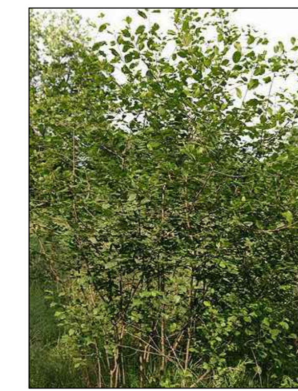
Sporkehout Frangula alnus solitair