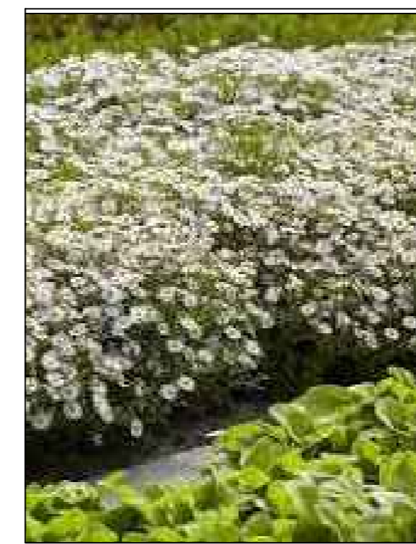
Herfstaster Aster ageratoides Asran