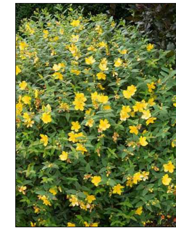
Herfsthooi Hypericum Hidcote