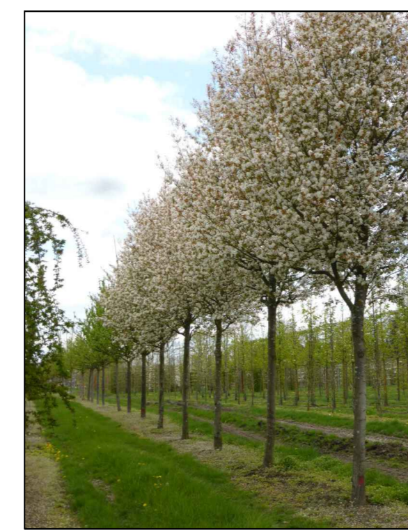
D - krentenboom Amelanchier arborea Robin Hill