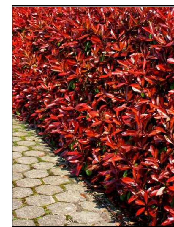
glansmisjel Photinia fraseri 'Red Robin'