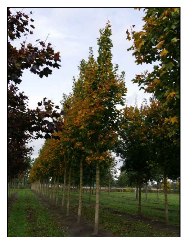
I - Noorse esdoorn emerald queen Acer platanoides emerald queen