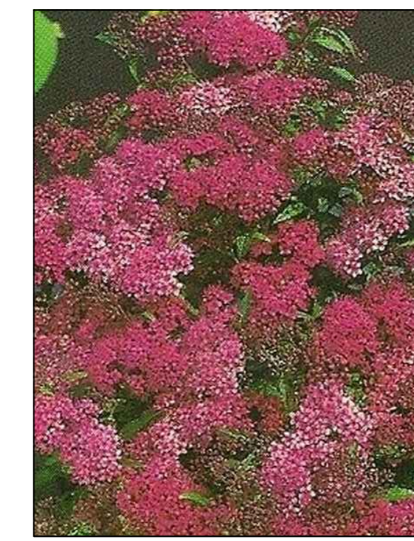
Spierstruik japonica dart's red Spirea japonica dart's red