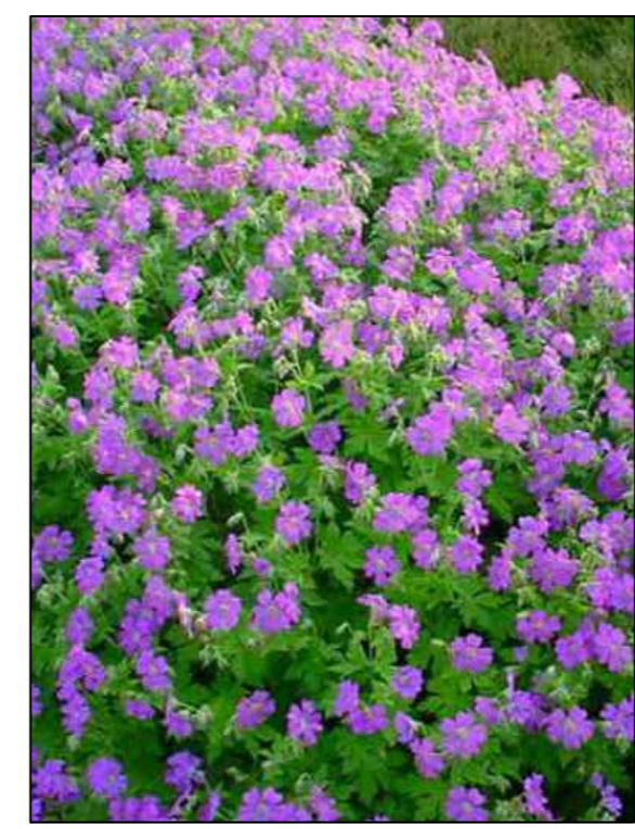
Doelvaarsbek Geranium cantrabrigense cambridge