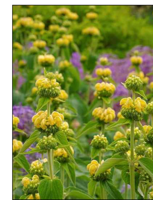
Brandkruid Phlomis russeliana