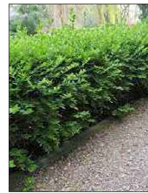
Struikkamperfoelie Lonicera nitida Mairgrun