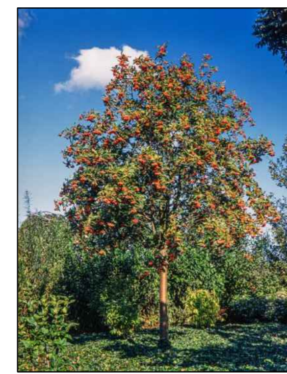
G - breedbladige meelbes henk vink Sorbus latifolia Henk vink