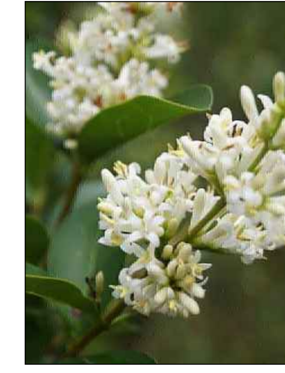
Ligusterhaag Ligustrum obtusifolium Dart spreader